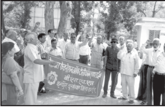
इंदौर में कर्मचारी जीएम के विरुद्ध प्रदर्शन करते हुए

बीएसएनएल कर्मचारी मोर्चा जिसमें एनएफटीई बीएसएनएल एफएनटीओ बीएमएस प्रमुख है इंदौर में आंदोलन कर रहे हैं। प्रशासन हर मामले में अपने विवेक का उपयोग नहीं कर रहा है। रोटेशन ट्रांसफर में फोन मैकेनिक के साथ न्याय नहीं हुआ है पारदर्शिता नहीं रखी गई। यहां तक कि प्रशासन ने मान्यता प्राप्त संघ के एक पदाधिकारी को ही ट्रांसफर पोस्टिंग के लिये अधिकृत कर दिया वह अपनी मर्जी से मनमाना