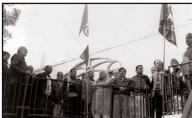
President and General Secretary hoisting the National Flag and NFTE flag respectively