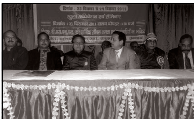
UP (East) conference at Unnao GS is sitting with Reception Committee Members